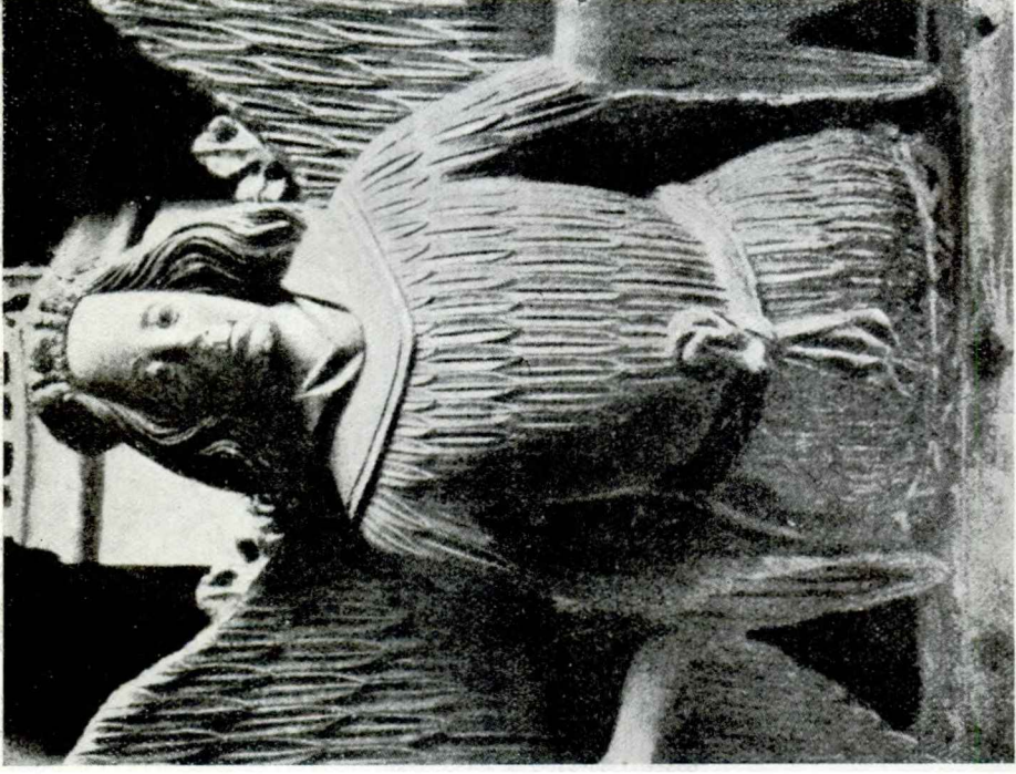
I. AM. II. — a ) Cambra de Comptos, de Pamplona. Sant Miquel: relleu. — b ) Abadia de Westminster (Londres). Capella d'Enric VII. Angel plumífer.